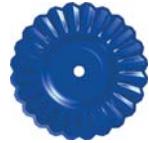
VT Rex 1933