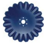
VT Rex 1958